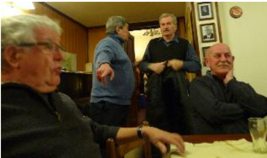
Podle této fotky by u něho asi nikdo z nás zkoušku dělat nechtěl