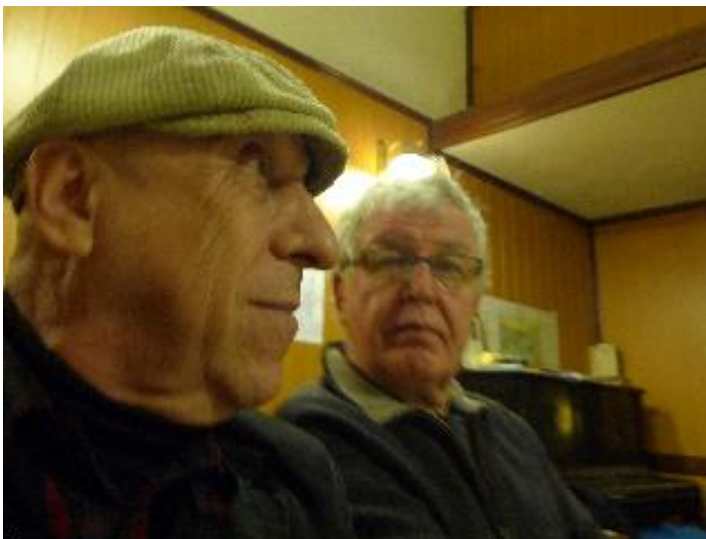
Na Plavcovi je přece jen vidět, že je to Profesor Yorkské univerzity.